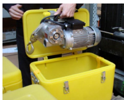
Coffret de transport inclus