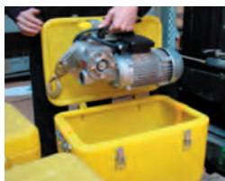
Coffret de transport inclus