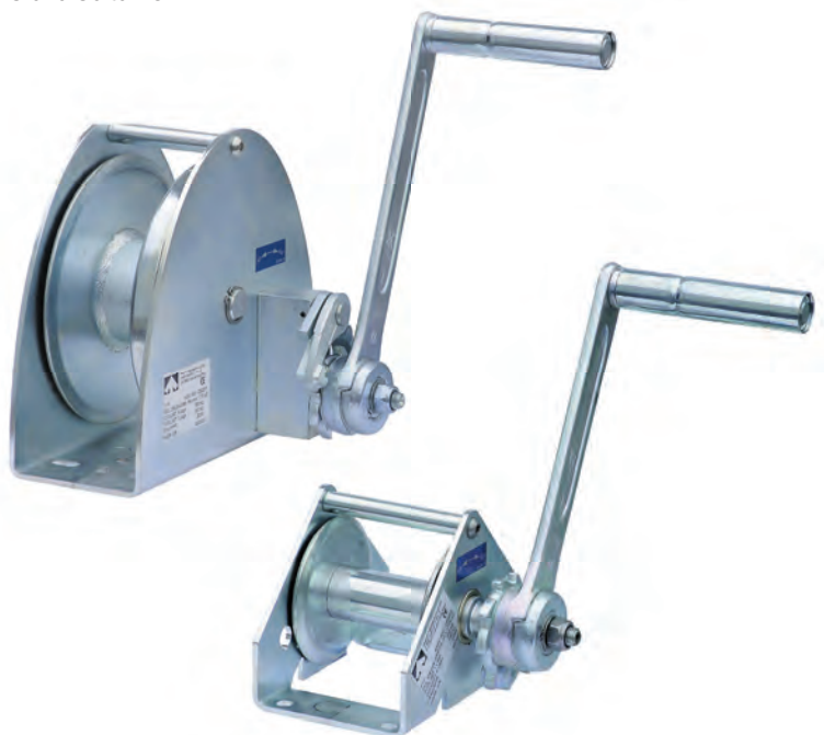
KWE INOX Siehe Seite 23