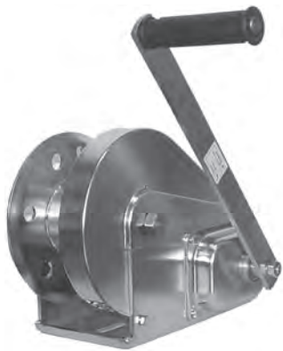
LHW-C INOX Siehe Seite 19