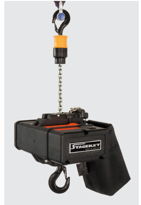
Kettenzüge für Kletterbetrieb