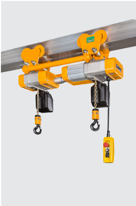
Für das absolute synchrone Heben